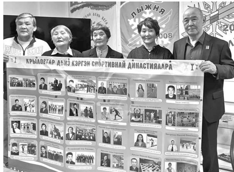
▲ Крыловтар дьэиэ кэргэн успурка династиялара.

Б ыйыл Сахабыт сиригэр успур көрүнгэрэ: хайыһар, чэпчэки атлетика уонна дуобат төрүттэммиттэрэ 100 сыла. Онон сибээстээн Уус Алдан улуһун бэтэрээн хайыһардыттара мустан, бу бэртээхэй түгэни бэлиэтээн, уруккуну-хойуккуну ахтан-санаан аастылар.