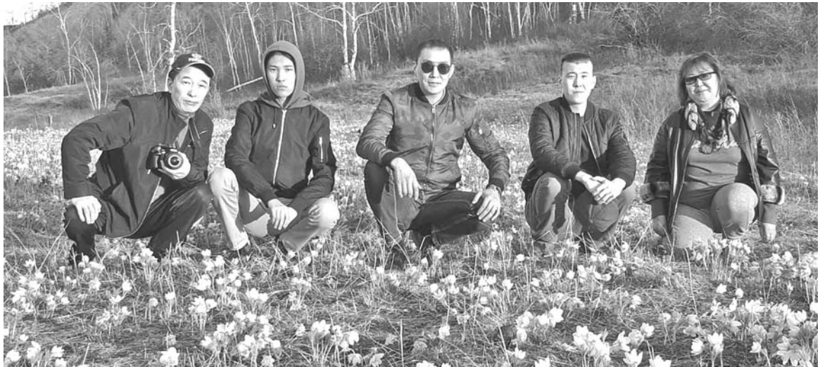
▲ С сыновьями.