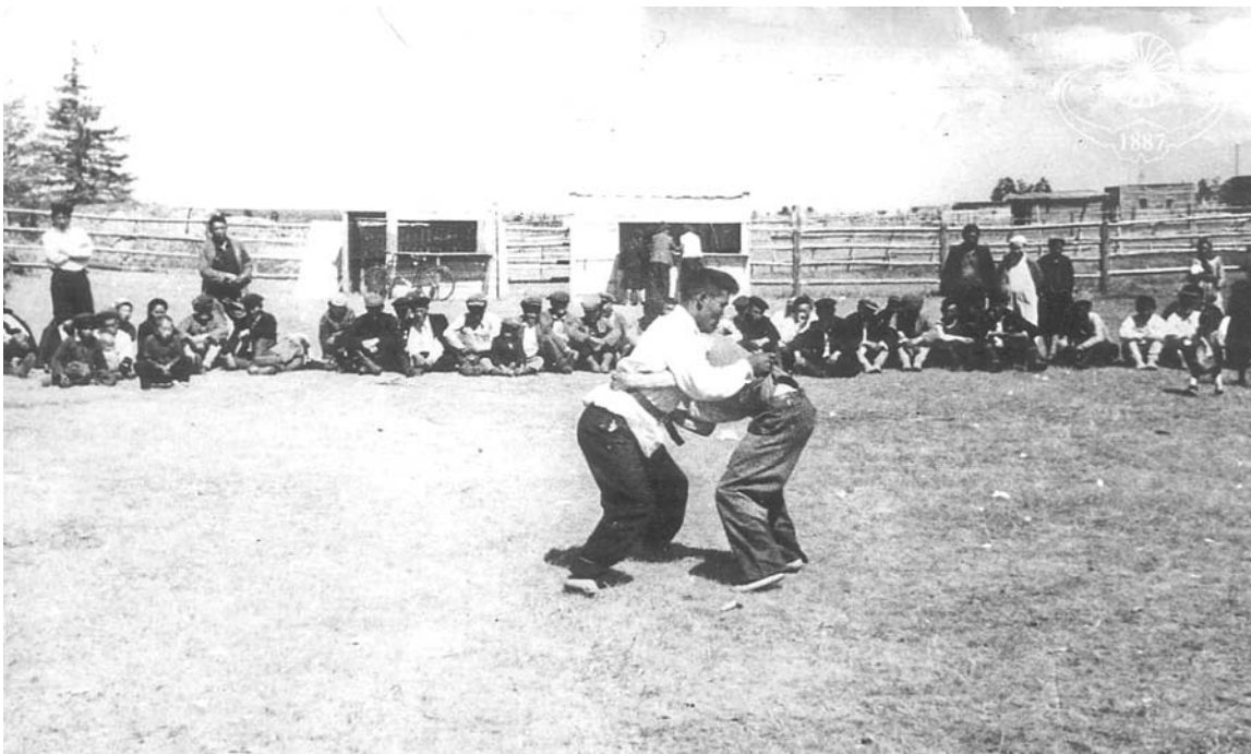
▲ Орджоникидзевской оройуонугар курдаһан тустуу, 1949 с.