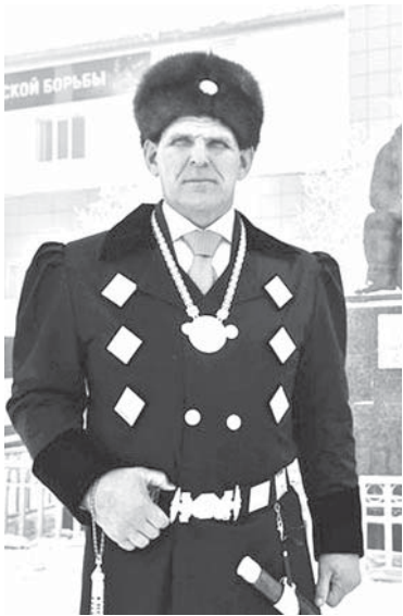
▲ Александр Карелин.

Ол курдук, олимпийскай оонньуулартан, аан дойду элбэх чемпионаттарыттан саҕалаан араас таһымнаах норуоттар икки ардыларыгар ытыгылар күрэхтэһиилэргэ, көрсүһүүлэргэ биһиги спортсменнарбыт куруук ситиһиилээхтик кытталлар. Олортон үксүгэр “илии тутуурдах, өттүк харалаах” дойдуларыгар эргиллэллэр. Биһиги спортсменнарбытыттан сүүһүнэн кини аан дойду, Европа, Азия уонна да атын күрэхтэһиилэр чемпионнара, Олимпийскай оонньуулар кыайыылаахтара уонна призера тахсыбыттара элбэҕи кэрэһэлиир.