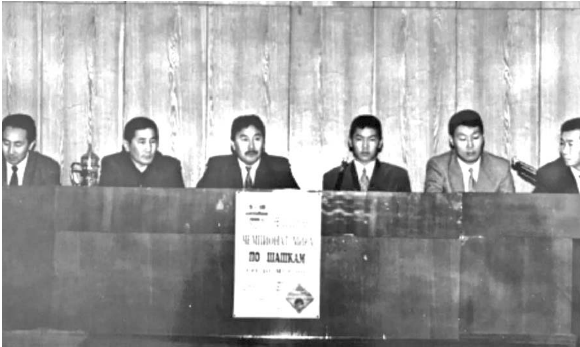
▲ Дуобакка улахан күрэхтэһи иннинээби тэрээһин, 1996 с.

(Салгыыта. Иннин хаһыат 23, 24 №-гэр көр).