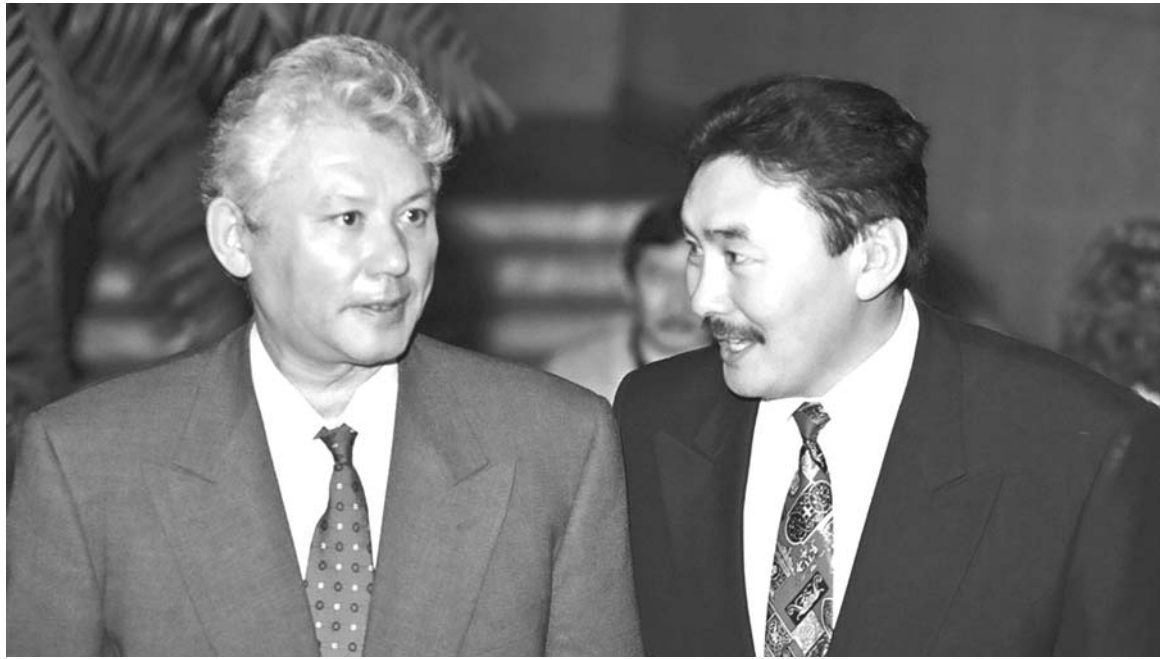
▲ Саха Республикатын бастаагы президентэ Михаил Ефимович Николаевтынын 18 сыл биридэ үлэлээбитим.

юзка биллэр тустуу маастардарын иитэн таһаарбыта. Элбэхтик биһигини мунһан олон, туох сыһаалахпытын, туохха дьулуһуохтаахпытын этэр этэ. Биридэ эмэ тустуу маастарын нуорматын туһунан кимиэхэ эмэ туһаайан кэпсэтэрэ. Хаһан да биһиэхэ Олимпийскай оонньуулары сыалсорук курдук турорбутун өйдөөбөппүн. Үөрөбү ылан, билиим үрдээн, күрэх түһүлгэтин эйгэтин син билэн баран, тре-